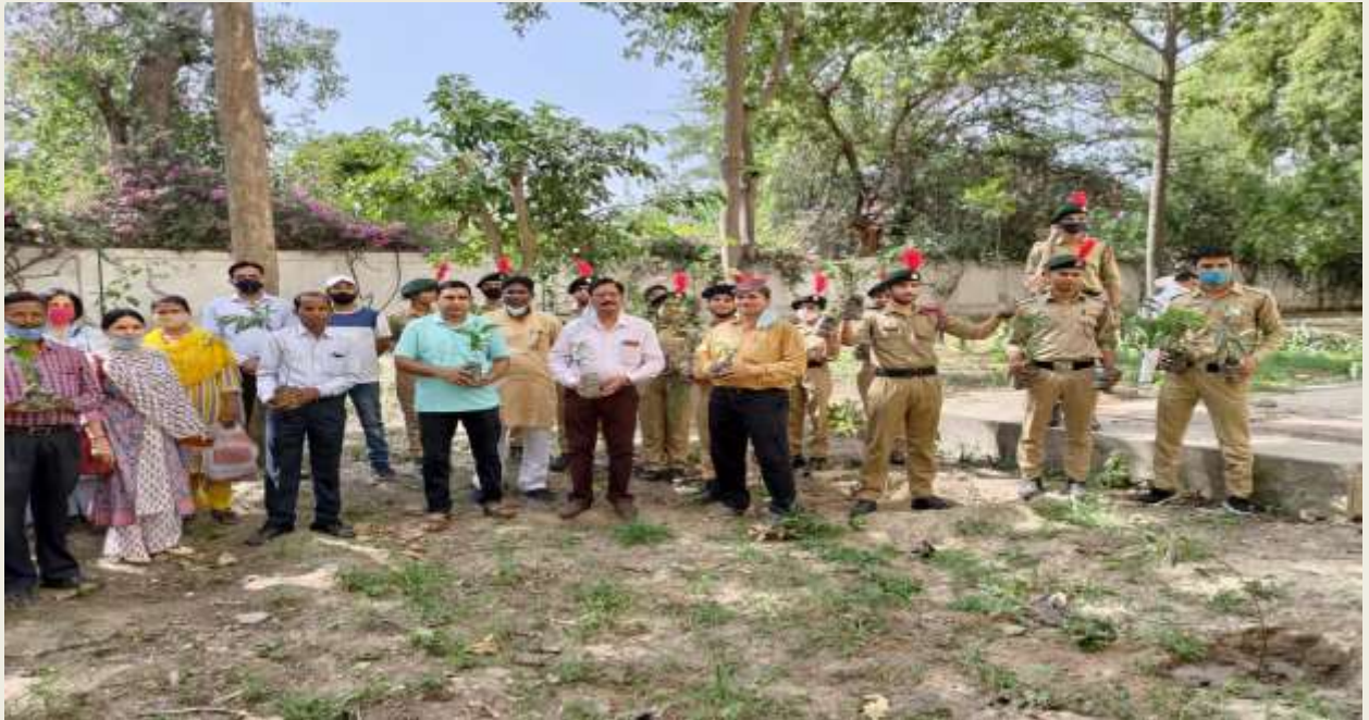
Plantation Drive in College