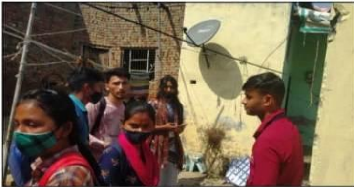
गांवों में स्वच्छता अभियान चलाते छात्र।